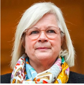
Catherine Vautrin, Ministre du Travail, de la Santé et des Solidarités

« Avec les Jeux Olympiques et Paralympiques de Paris 2024, notre ambition est claire : mettre cet événement unique au service de notre objectif de plein emploi, dans une perspective de long terme. Nous nous engageons à accompagner chaque secteur concerné, en veillant à ce que les opportunités générées profitent également à ceux actuellement en retrait du marché du travail, marquant ainsi un tournant décisif vers une économie plus inclusive et dynamique. »