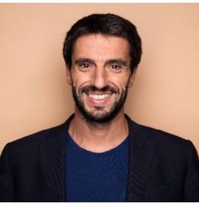
Tony Estanguet, Président de Paris 2024

« France Travail se mobilise pour faire des Jeux de Paris 2024 une opportunité pour tous. Nous sommes déterminés à aligner les compétences des demandeurs d'emploi avec les besoins précis des secteurs qui recrutent, en assurant une formation ciblée et en anticipant les évolutions du marché du travail. Notre objectif est de garantir que chaque candidat puisse trouver sa place, transformant ainsi les enjeux de recrutement en opportunités d'emploi durable pour tous. »