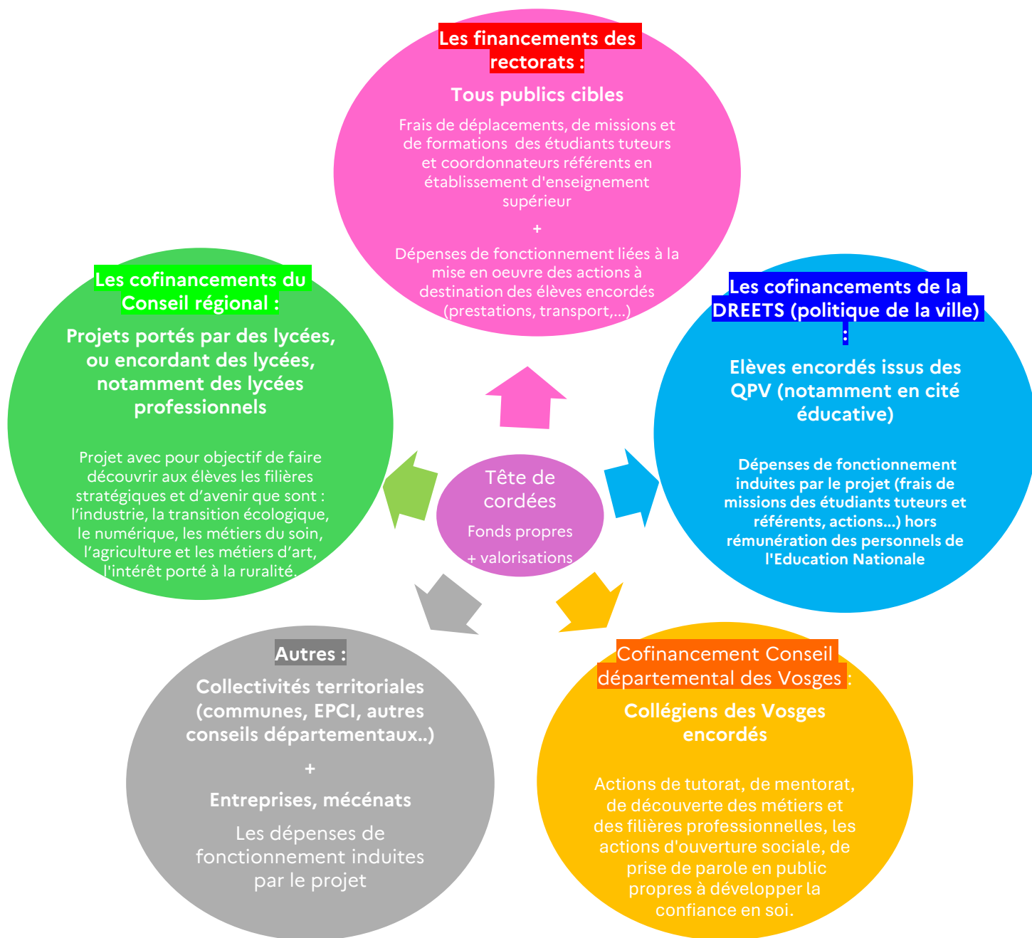
Schéma des différentes sources financières en fonction des spécificités de chaque financeur